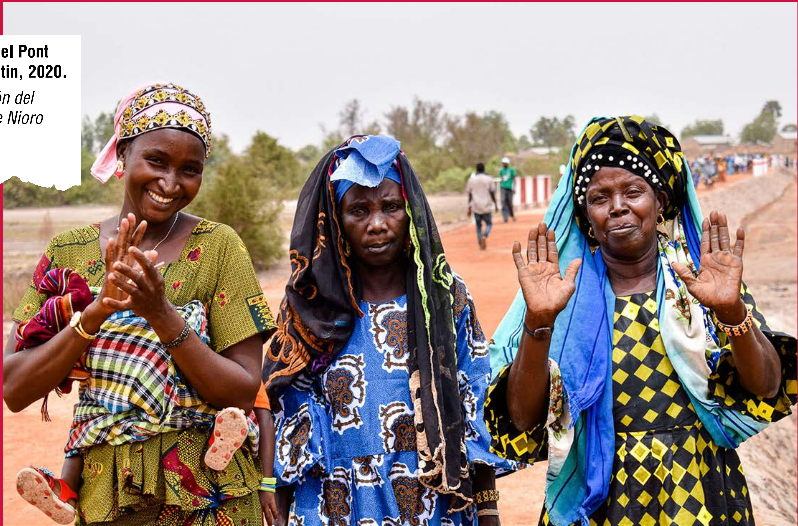
Dones celebrant la inauguració del Pont d'Entrecanals, Poble de Niore Katin, 2020. Mujeres celebrando la inauguración del Puente de Entrecanales, Pueblo de Niore Katin, 2020.