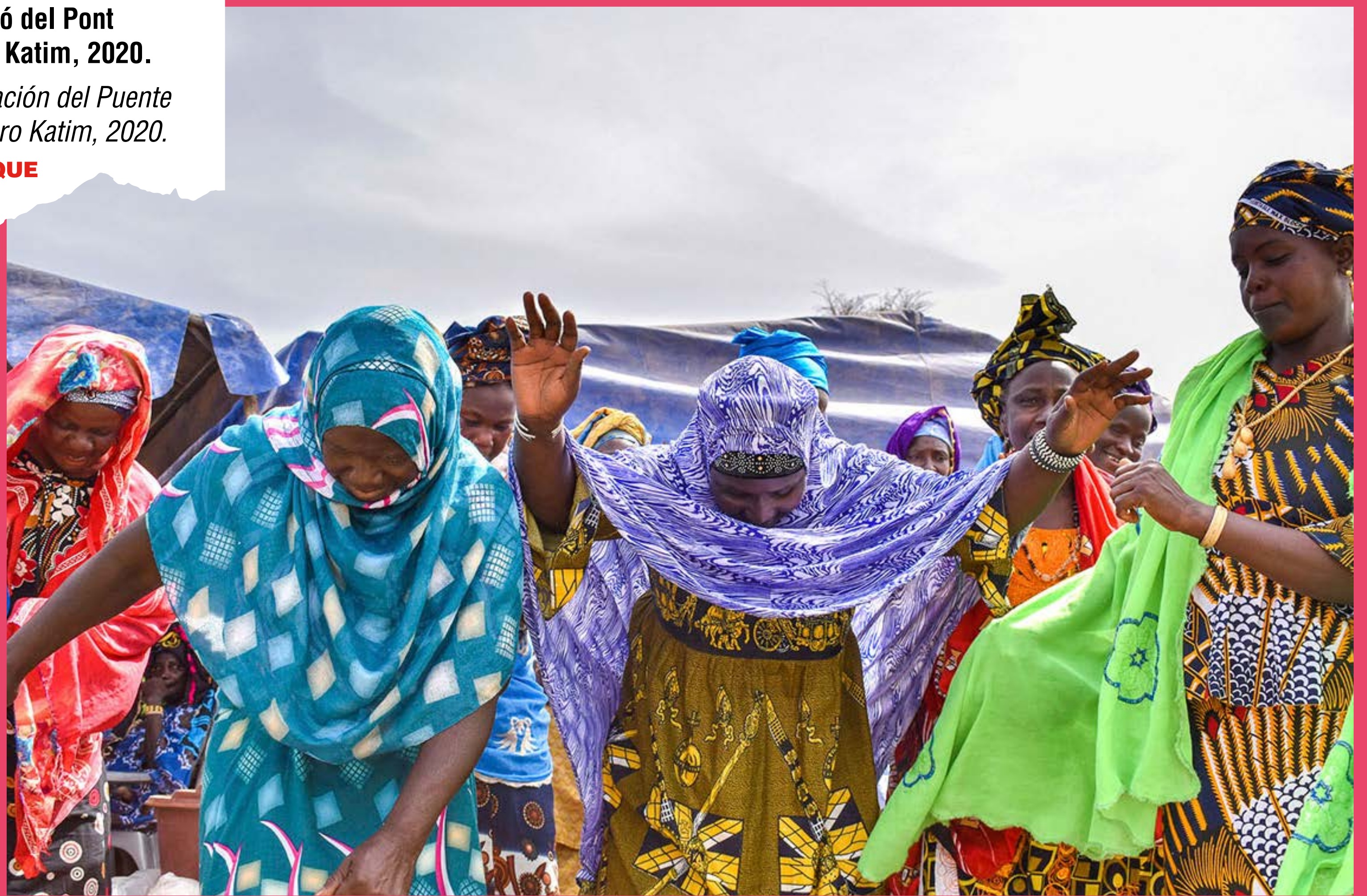
Una participant en el projecte amb el menjador escolar, Poble de Loboudou Doue.

Una participante en el proyecto con el comedor escolar, Pueblo de Loboudou Doue.