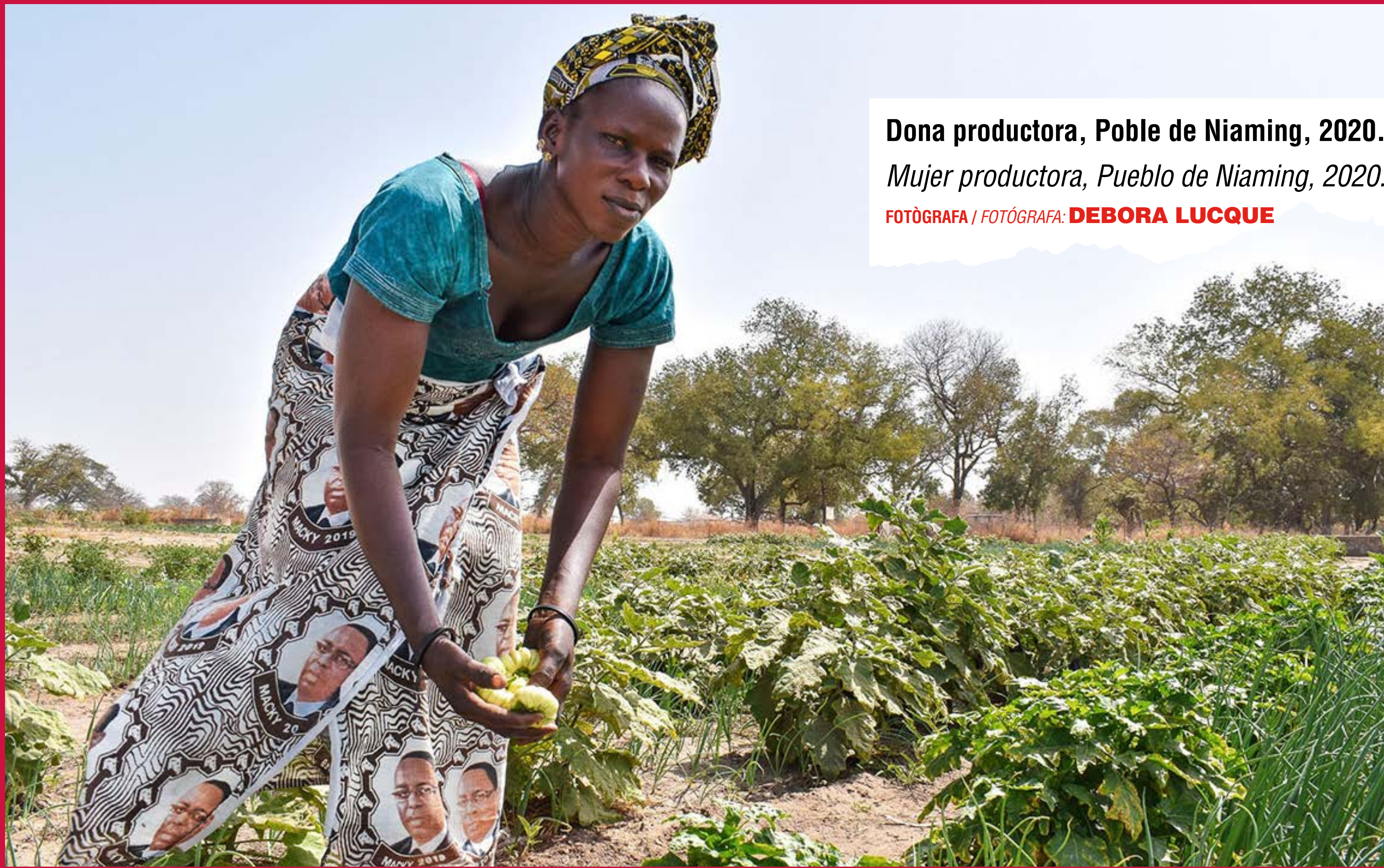
Dona productora, Poble de Niaming, 2020. Mujer productora, Pueblo de Niaming, 2020.