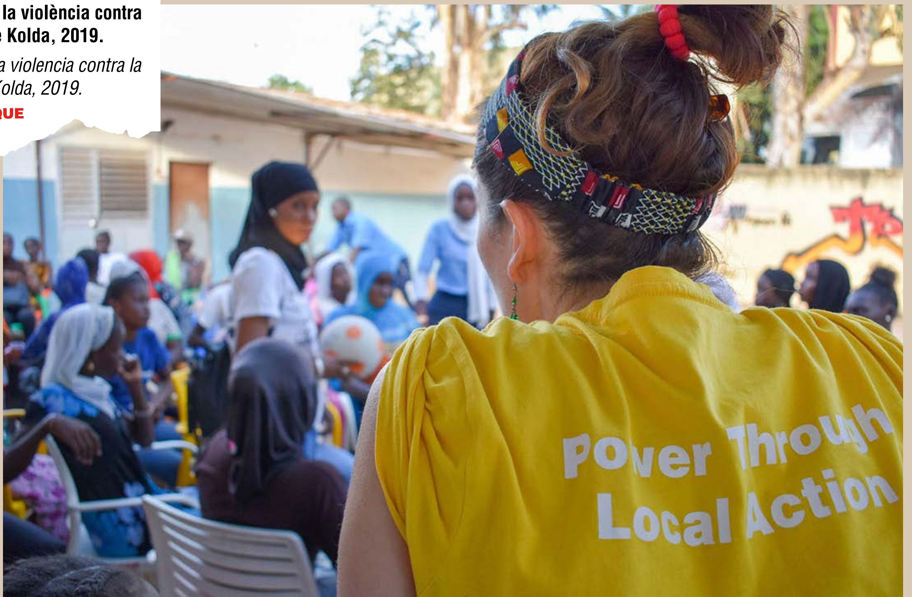
Taller de sensibilització sobre la violència contra la dona, Centre de Joventut de Kolda, 2019. Taller de sensibilización sobre la violencia contra la mujer, Centro de Juventud de Kolda, 2019.