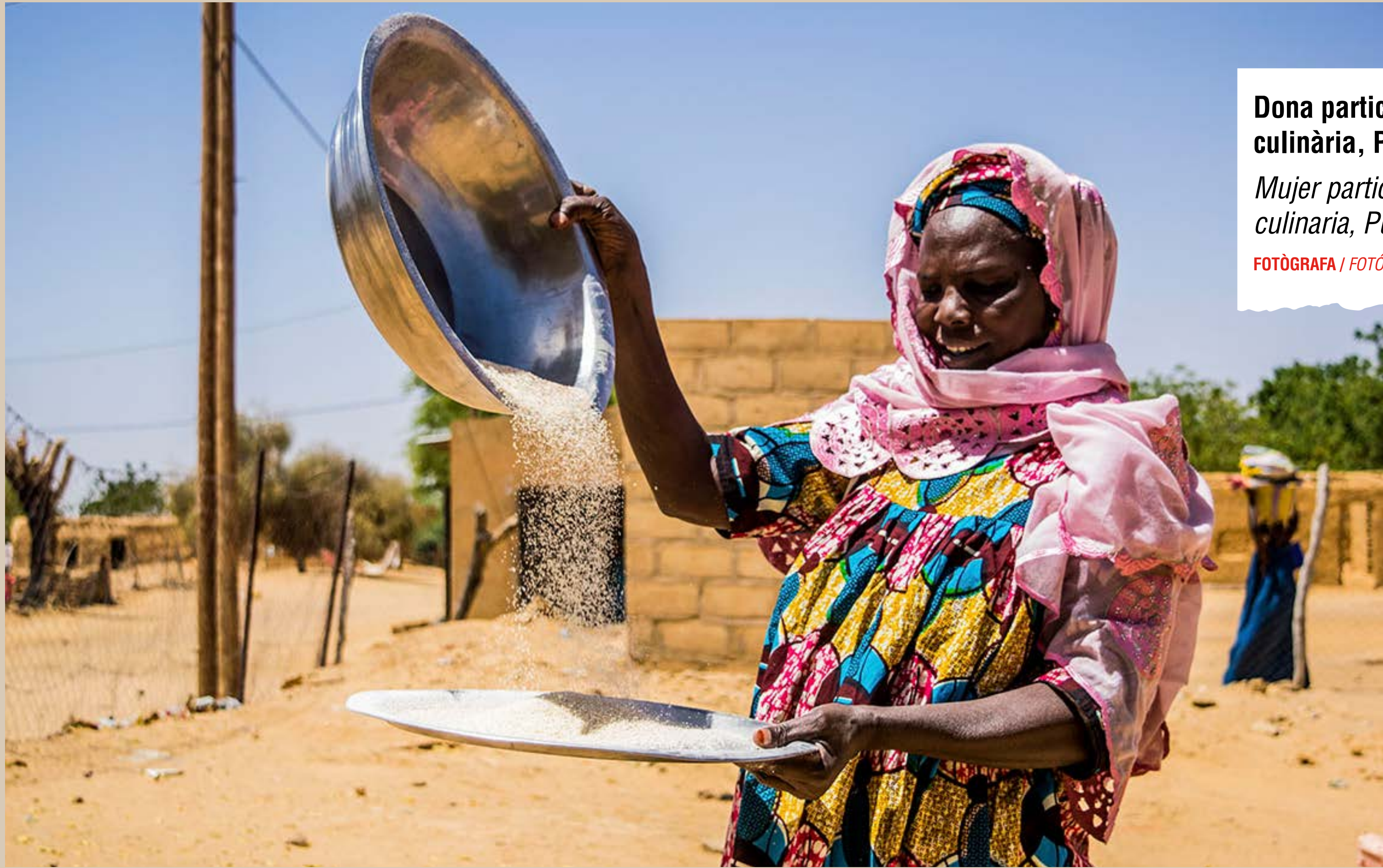
Dona participant en una demostració culinària, Poble de Daara. Mujer participando en una demostración culinaria, Pueblo de Daara.