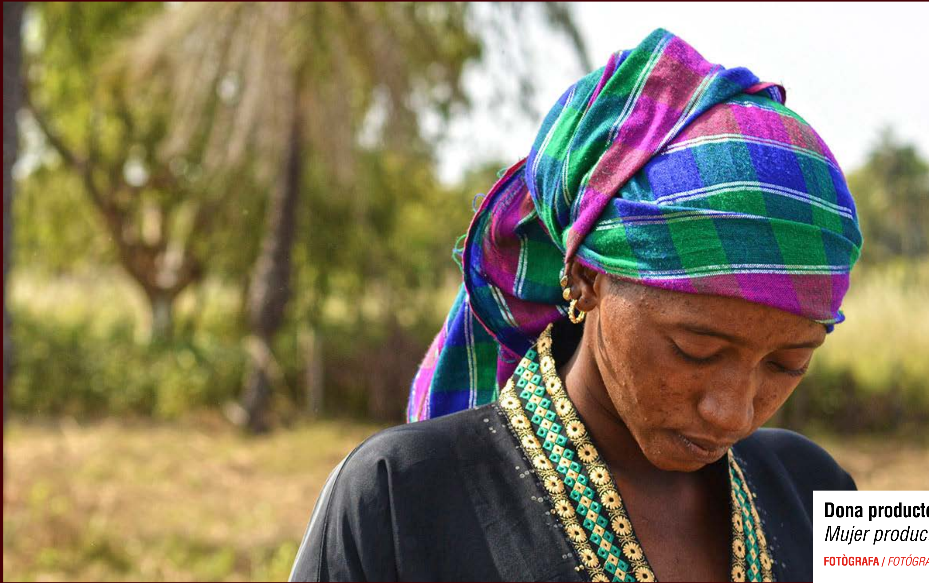
Dona productora, Poble de Diyabougou, 2018 Mujer productora, Pueblo de Diyabougou, 2018