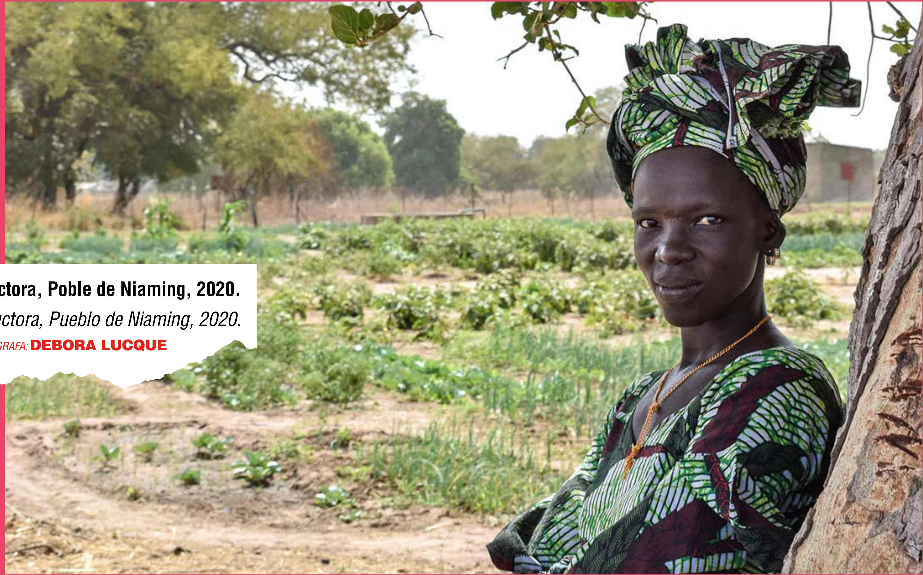
Dona productora, Poble de Niaming, 2020.

Mujer productora, Pueblo de Niaming, 2020.