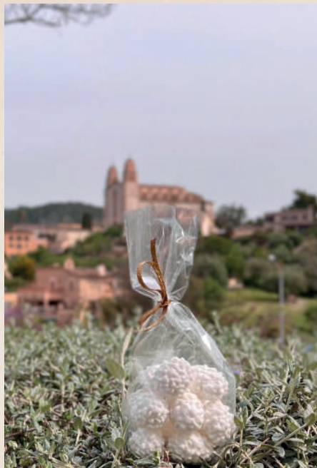
Confits típics de Pasqua, que les caperutxes repar- teixen durant les processons