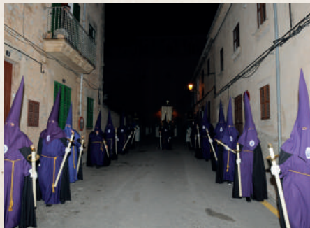
Passos de processó als carrers de la vila de Calvià

Segona festa de Pasqua i pancaritats En molts de pobles de Mallorca també és festa el dilluns de Pasqua i, en alguns, també el dimarts o tercera festa , de manera que de la segona festa de Pasqua en diuen sa mitjana festa , perquè queda en l'entremig. Aquests dies posteriors al dia de Pasqua és costum d'anar a menjar les darreres panades i passar el dia en comunitat (i fer la vega) amb la resta del poble en un indret proper a la vila. Són els anomenats pancaritats , que alguns pobles celebren el dia de la tercera festa de Pasqua i altres el Diumenge de l'Àngel. Aquest darrer és el cas de Calvià vila, que fa la trobada en aquesta festivitat a l'ermita de la Pedra Sagrada, i, des Capdellà, que la fa a la possessió de Son Alfonso.