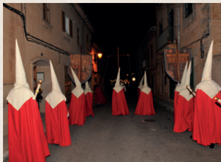
Passos de processó als carrers de la vila de Calvià