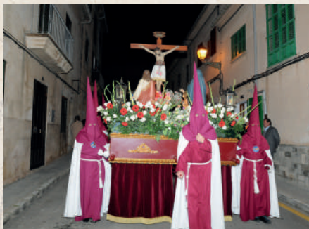
Pasos de processó als carrers de la vila de Calvià