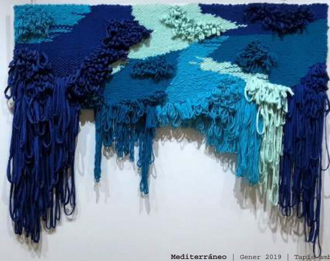
Mediterráneo | Gener 2019 | Tapís amb marc de fusta