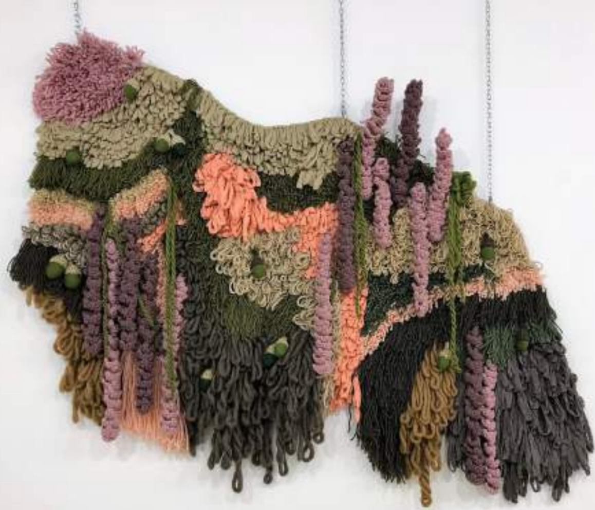
Campo | Setembre 2020 | Tapís amb xarxa de canyamàs