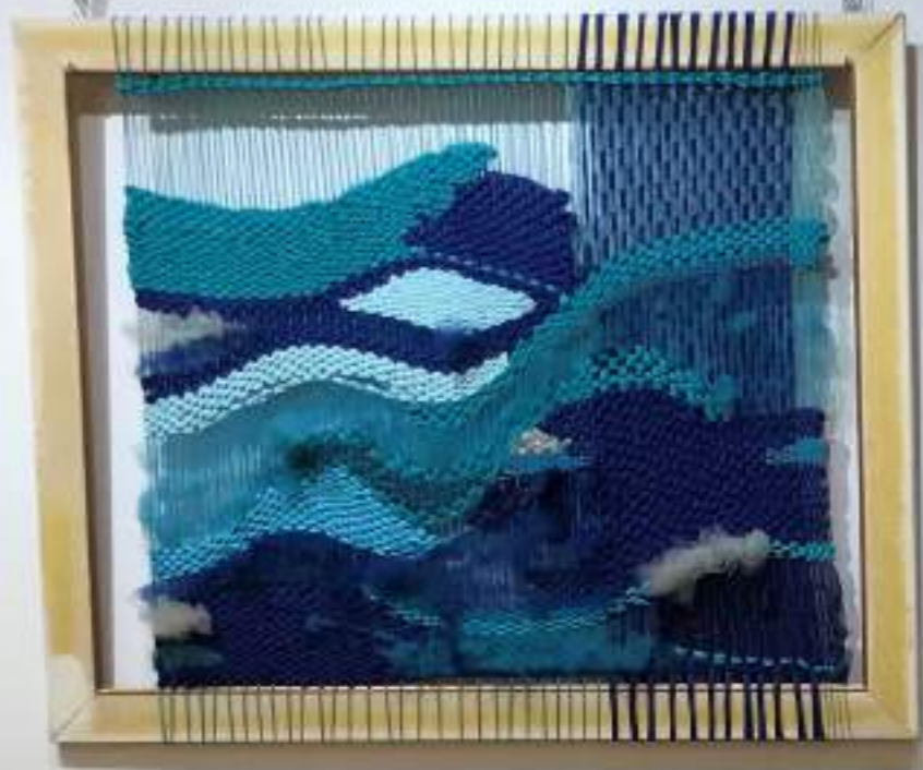
Azul | Febrer 2019 | Tapís amb marc de fusta