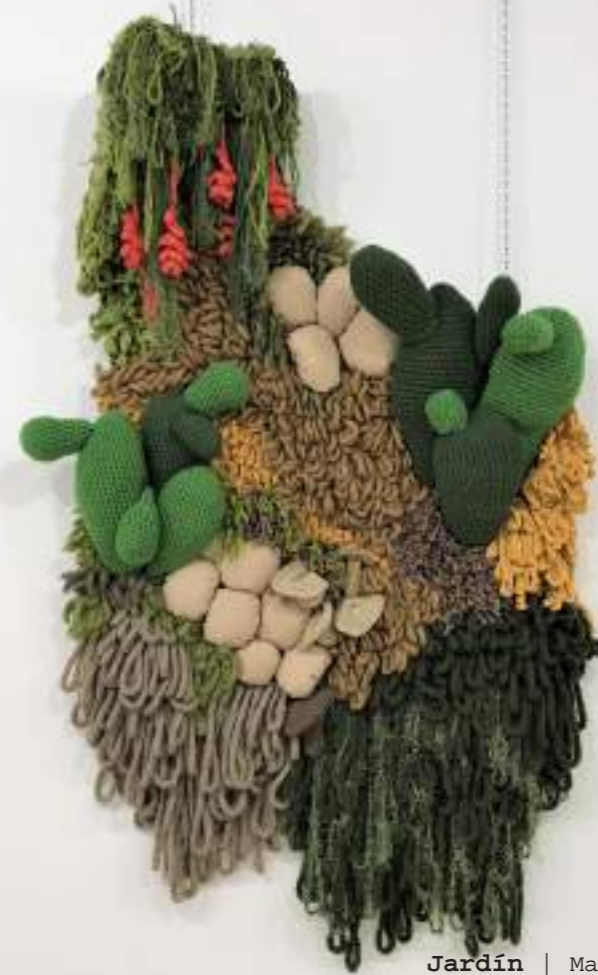
Jardín | Mayo 2020 | Tapís amb xarxa de canyamàs